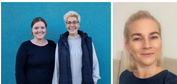
Foto vom Team